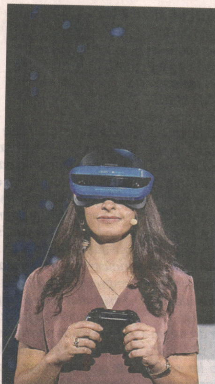
» NOVIDADE Funcionária da Micros realidade virtual em NY; empresa lança versão do sistema operacional para I

A ex-presidente Dilma Rousseff anunciou no programa de concessão, apresentado em 2015, que faria a renovação de concessões de rodovias e ferrovias em troca de investimentos estimados em R$ 30 bilhões. (RANIER BRAGON)